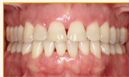
Afb. 1c. Na 6 maanden orthodontie