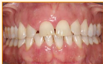
Afb. 1a. Intake

Bij patiënten met parodontitis kan orthodontische behandeling plaatsvinden wanneer de infectie onder controle is. De patiënte van afbeelding 1a stond op het punt om een traject van initiële therapie en parodontale chirurgie te doorlopen en had nadien de wens esthetiek te verbeteren. De orthodontische behandelduur betrof 9 maanden (Afb. 1b en 1c). Bij een onregelmatige tandstand kan orthodontische regulatie de plaquebeheersing bevorderen voor een duurzaam resultaat op de lange termijn.