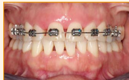
Afb. 1b. Start orthodontie